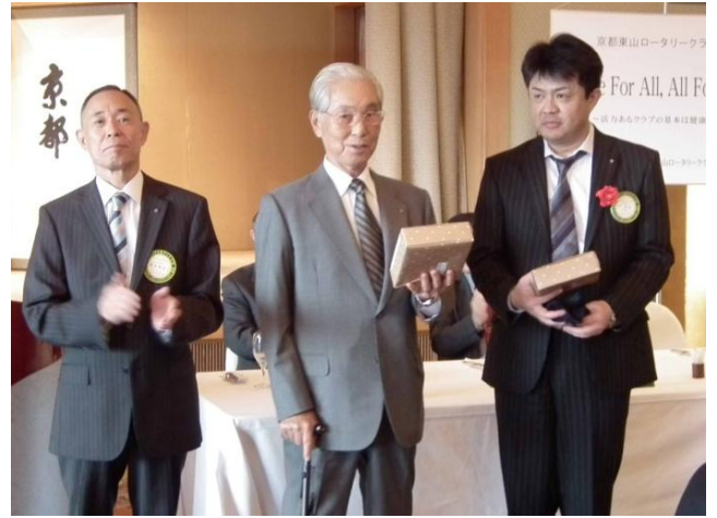
11/6(火) クラブ・デー 出席100%、お誕生日お祝い おめでとうございます😊