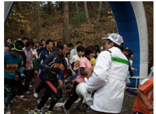
12/1(土)ー45周年記念事業ー 「宝ヶ池公園ファミリーマラソン」