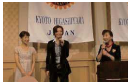
納涼家族会 ～宝塚歌劇鑑賞～