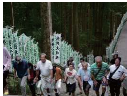
納涼家族会～南紀白浜～