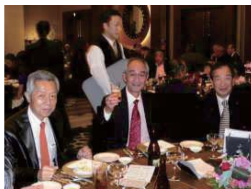
年忘れ家族会 ～エキシブ京都八瀬離宮～