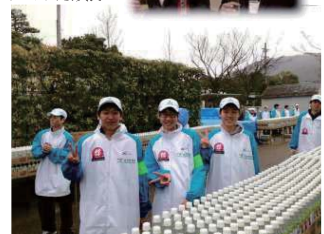
京都マラソン2013ボランティアにも参加