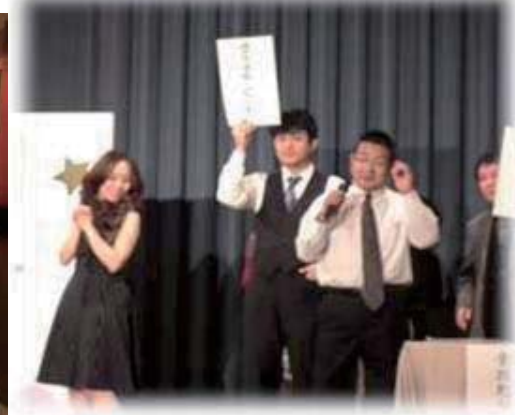
年忘れ家族会 ～アトラクション「水戸黄門」～