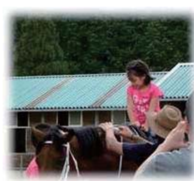
納涼家族会 ～京都府立ゼミナールハウス /高宮ライディングパーク～