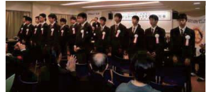
たくさんの皆さまに門出を祝っていただきました