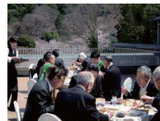
お花見例会 ～ウェスティン都ホテル京都～