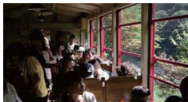
納涼家族会 ～保津峡トロッコ&川下りと鵜飼見学