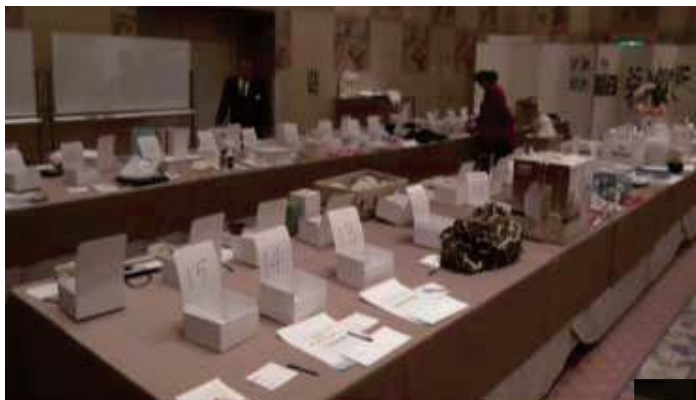
年忘れ家族会 東日本大震災被災地支援「チャリティーオークション」