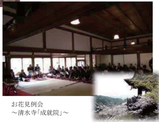
お花見例会 ～清水寺「成就院」～