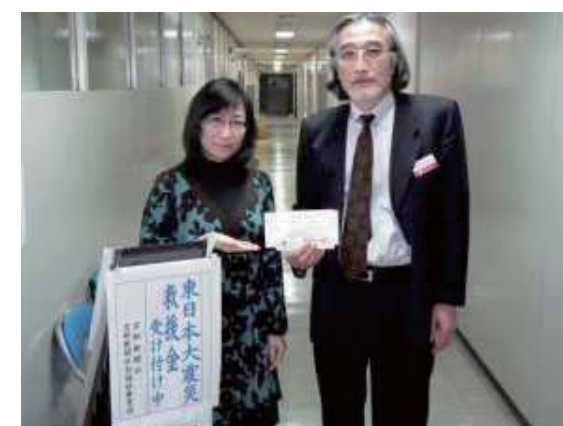
2011年3月に発生した東日本大震災への救援金を 京都新聞社会福祉事業団へ