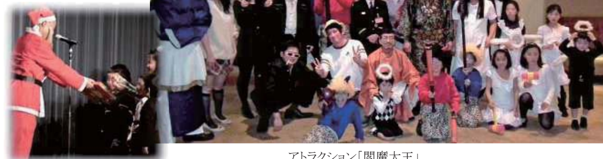
アトラクション「閻魔大王」