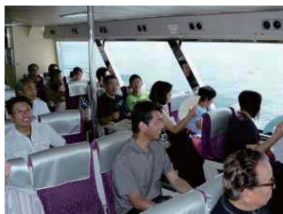
納涼家族会 ～長浜・竹生島・近江今津～