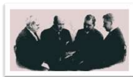
ロータリーの「最初の4人」 シルベスター・シール、 ポール・ハリス、 ハイラム・ショーレー、 ガス・ローア

また、京都ゆかりの文化・芸術を中心とした方々を卓話にお迎えし、会員の精神の向上を充実いたしたいと考えております。何卒会員諸氏の御協力、御指導を切に賜りますよう心からお願い申し上げます。