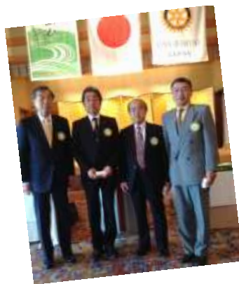
前年度のみなさま おつかれさまでした。