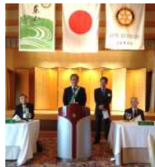
ご入会おめでとう ございます。