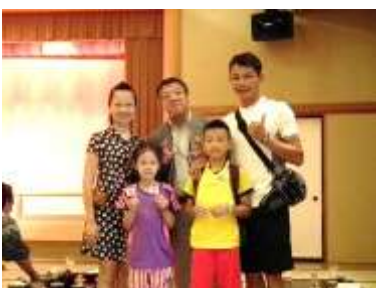
みなさま、お疲れ様でした。