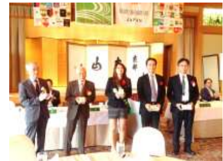
100%出席、お誕生日、表彰 おめでとうございます。