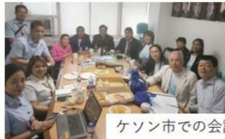
ケソン市での会議の様子

【フィリピン・ケソン市の協働RC】 RC Timog / RC Metro San Francisco Del Monte / RC South Triangle