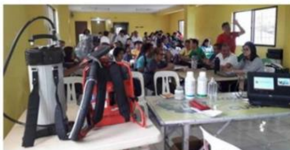
トレーニングの様子