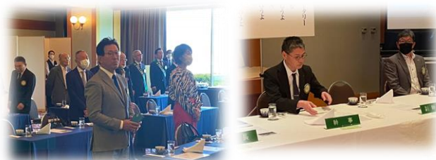
当日は、クラブデー開催、例会後は現年度引継ぎ協議会並びに次年度委員長会議を開催しました。