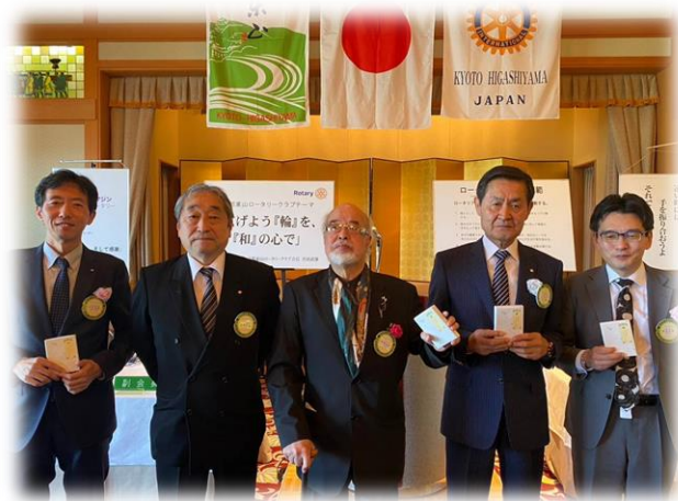
今月のお祝いの皆様おめでとうございます