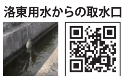
洛東用水からの取水口