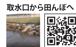
取水口から田んぼへ