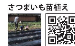
さつまいも苗植え