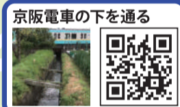
京阪電車の下を通る