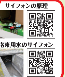
サイフォンの原理