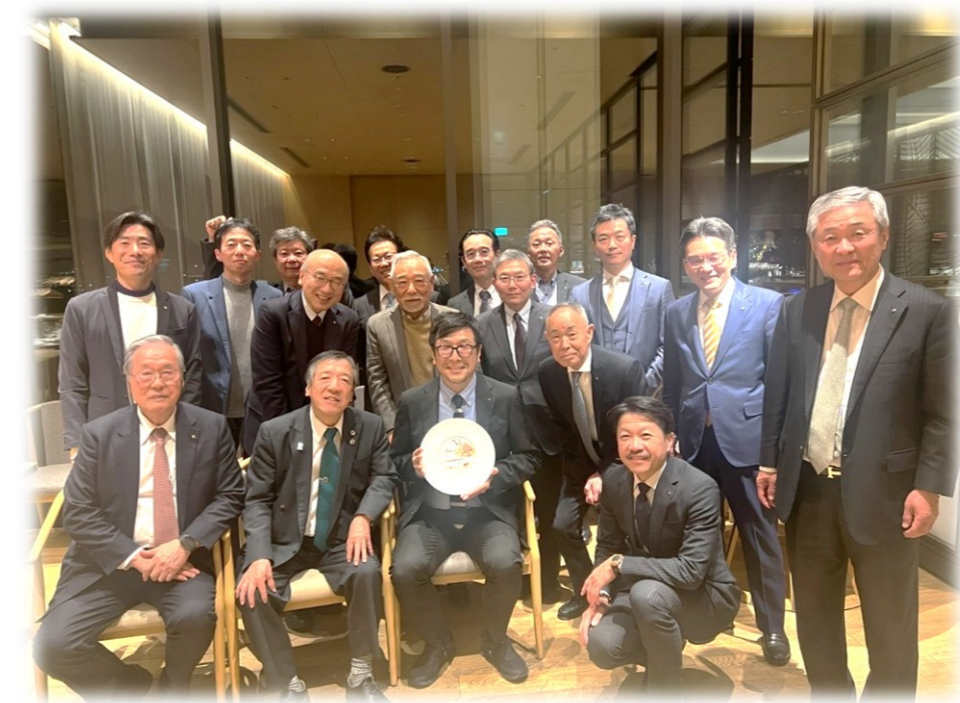
合同会議「クラブ戦略・60周年の合同会議、ありがとうございました」