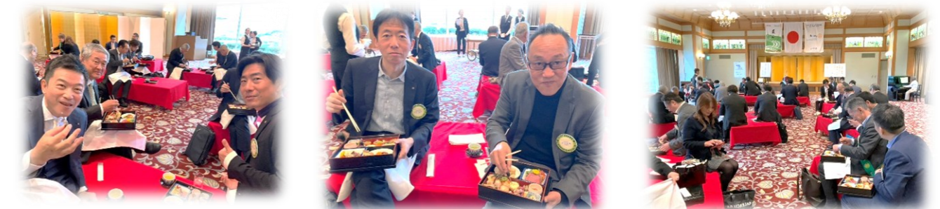
「天候には恵まれませんでしたが、床几で例会」